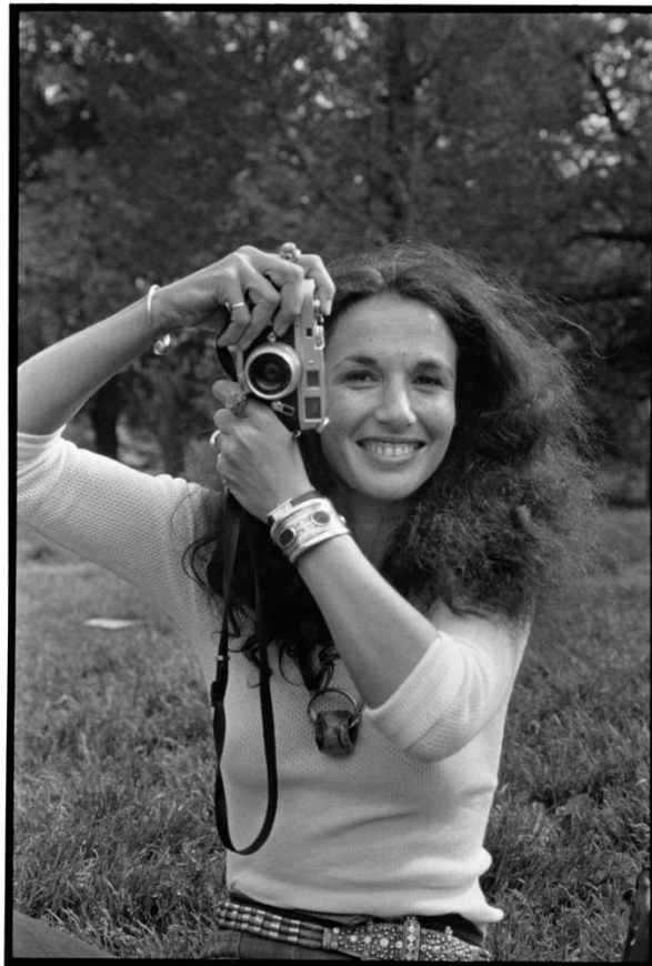
Mary Ellen Mark con su Leica en Central Park, Nueva York, ca. 1970.

Mary Ellen Mark: Vidas de mujeres , recopila fotografías, películas y material para explorar el trabajo que Mark realizó durante la segunda mitad del siglo XX documentando una gran variedad de mujeres en situaciones diversas.