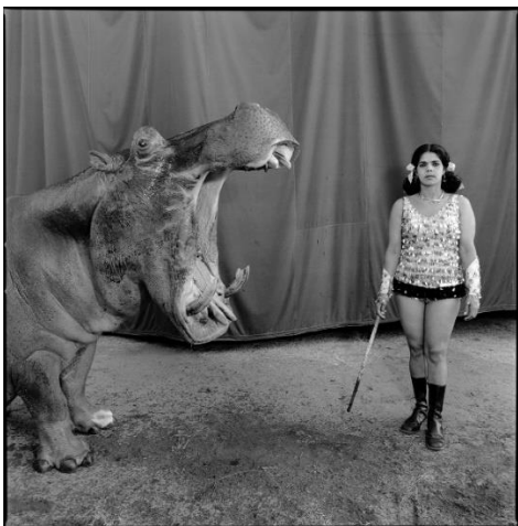
MARY ELLEN MARK Hipopótamo e intérprete, Great Rayman Circus. Madrás, India, 1989 © Mary Ellen Mark