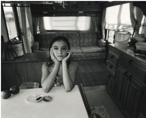
MARY ELLEN MARK Niña acróbata de circo en su tráiler. Oaxaca, México, 2008 © Mary Ellen Mark