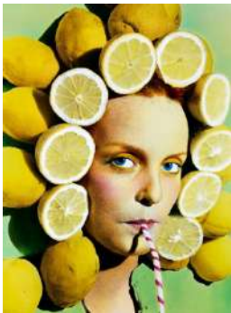
Ouka Leele Peluquería, 1978-1980 Copia digital (Vitra)