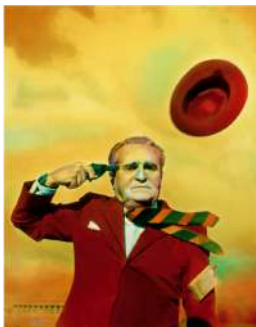
Ouka Leele Un domingo por la mañana , 1981 Copia digital (Vitra) © Ouka Leele/VEGAP