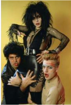
Pablo Pérez-Mínguez Póster Rock-Ola: Alaska, Pedro y Fabio, 1983 Cibachrome, copia posterior © Pablo Pérez-Mínguez/VEGAP