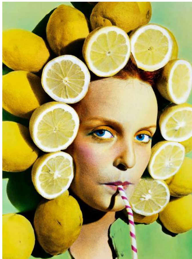
Ouka Leele, Peluquería 16, 1978 – 1980

Els quatre fotògrafs que articulen l'exposició van ser indiscutibles protagonistes de La Movida: Alberto García-Alix , Ouka Leele , Pablo Pérez-Mínguez i Miguel Trillo . Tots ells van conviure, es van creuar i, a la seva manera, cadascun d'ells va ser un cronista de La Movida. L'excel·lència de la fotografia d'aquest període és precisament la seva aportació individual, reflex de la diversitat dels mons en els que es van bolcar i de les seves riques personalitats des d'un punt de vista fotogràfic i que donen com a resultat una mirada polièdrica d'aquell moment.