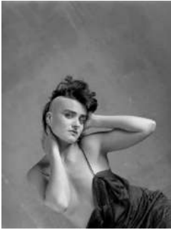
Alberto García-Alix Ana Curra esperando mis besos , 1984 Gelatina y plata sobre papel baritado, tintado al té. Copia de época

L'ús d'aquestes fotografies queda restringit a la il·lustració de l'exposició de Foto Colectania. Preguem no ometin la referència al copyright de les imatges.