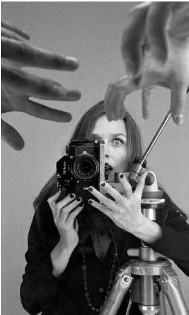
Ouka Leele, autorretrato