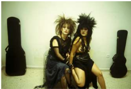
Miguel Trillo Concierto de Cadena Perpetua en el Festival Lega-Rock. Leganés (Madrid), 1984 Cibachrome, copia de época © Miguel Trillo/VEGAP