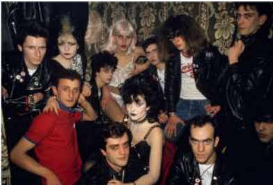
Pablo Pérez-Mínguez Camerinos del Marquee. Concierto de Alaska y los Pegamoides, 1981 Copia digital © Pablo Pérez-Mínguez/VEGAP