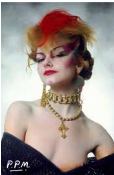
Pablo Pérez-Mínguez Divina May, 1982 Cibachrome, copia posterior © Pablo Pérez-Mínguez/VEGAP