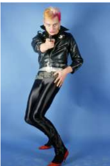
Pablo Pérez-Mínguez Fabio, agente secreto, 1982 Cibachrome, copia posterior