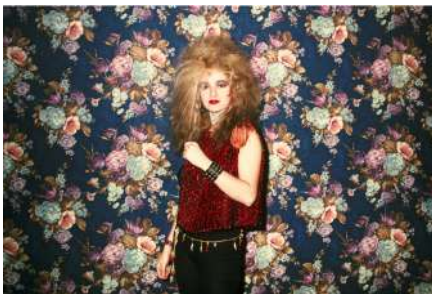
Miguel Trillo En la sala Rock-Ola. Madrid, 1982 Cibachrome, copia de época