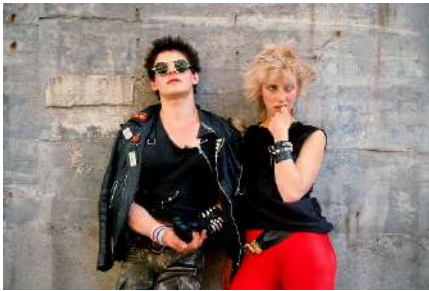
Miguel Trillo Junto a Rock-Ola. Madrid, 1983 Cibachrome, copia de época