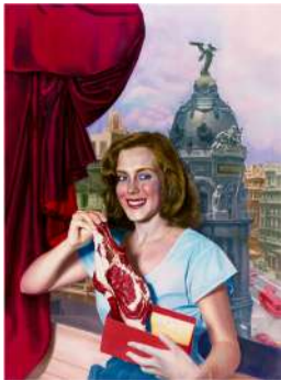
Ouka Leele Madrid , 1984 Cibachrome a partir de una fotografía en blanco y negro pintada con acuarelas. Copia de época © Ouka Leele/VEGAP