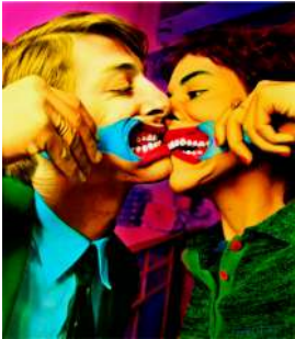
Ouka Leele El beso , 1980 Copia digital (Vitra) © Ouka Leele/VEGAP